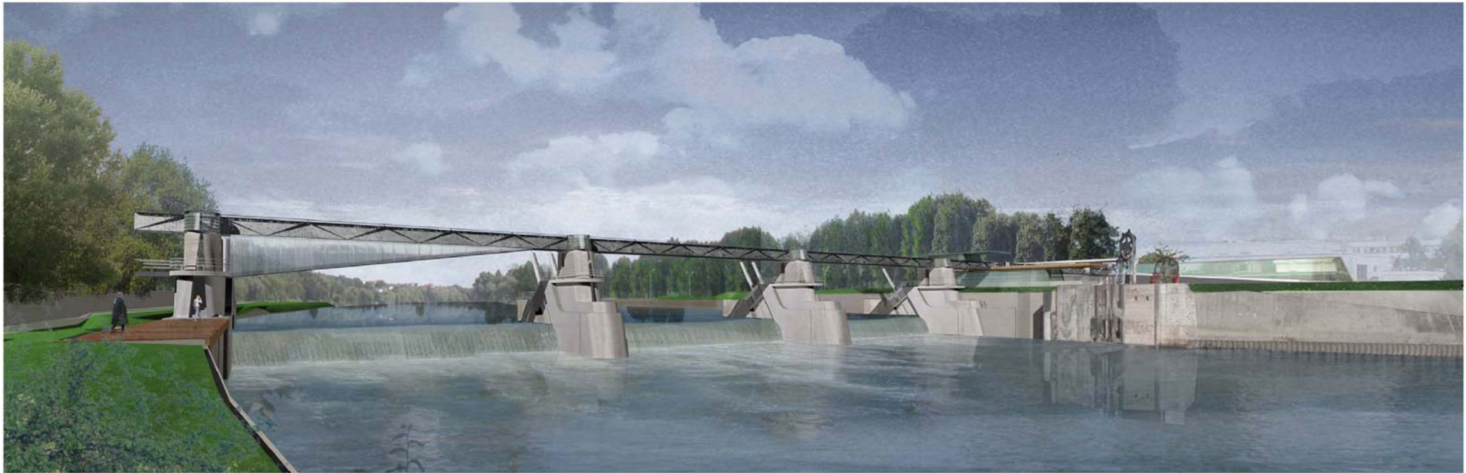
Luc Weizmann Architecte / Janvier 2005